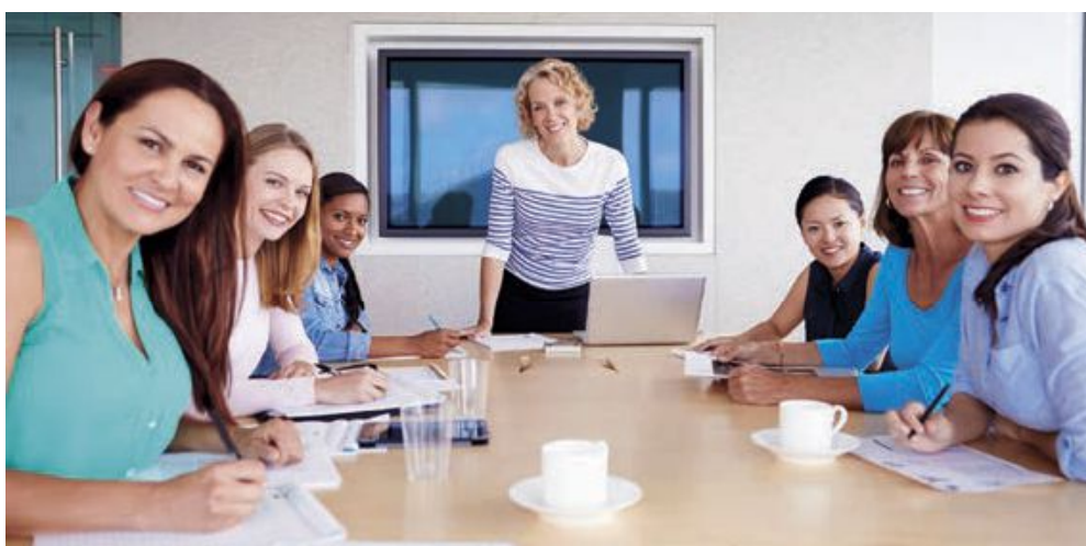
ÉVOLUTION DES % MOYENS DES POSTES OCCUPÉS PAR DES ADMINISTRATRICES / TOTAL DES POSTES D'ADMINISTRATRICES